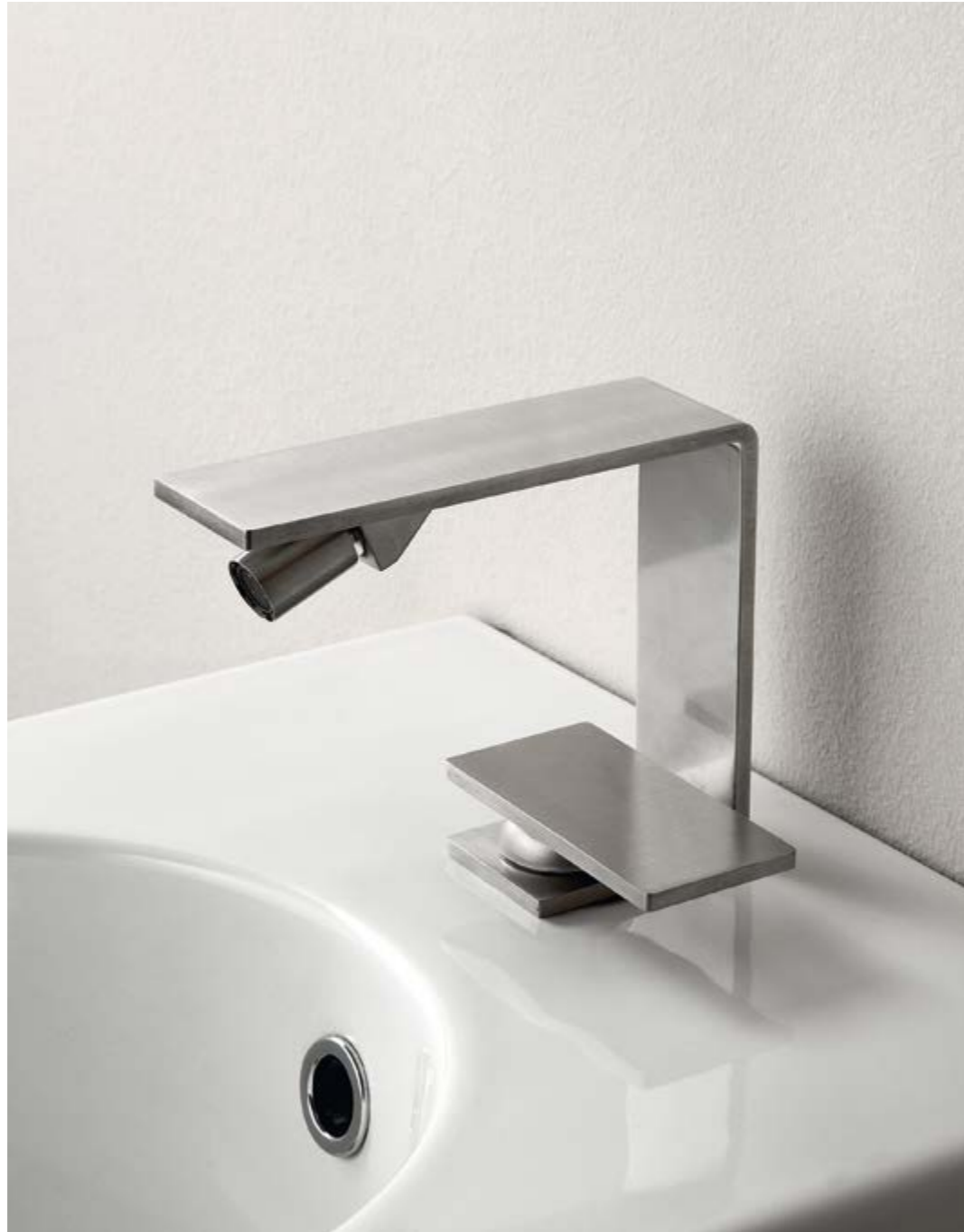
IT 2822 IS 5M ZZ